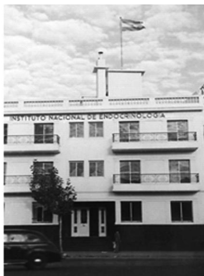
Instituto Nacional de Endocrinología, del cual el profesor Pasqualini fue su primer director